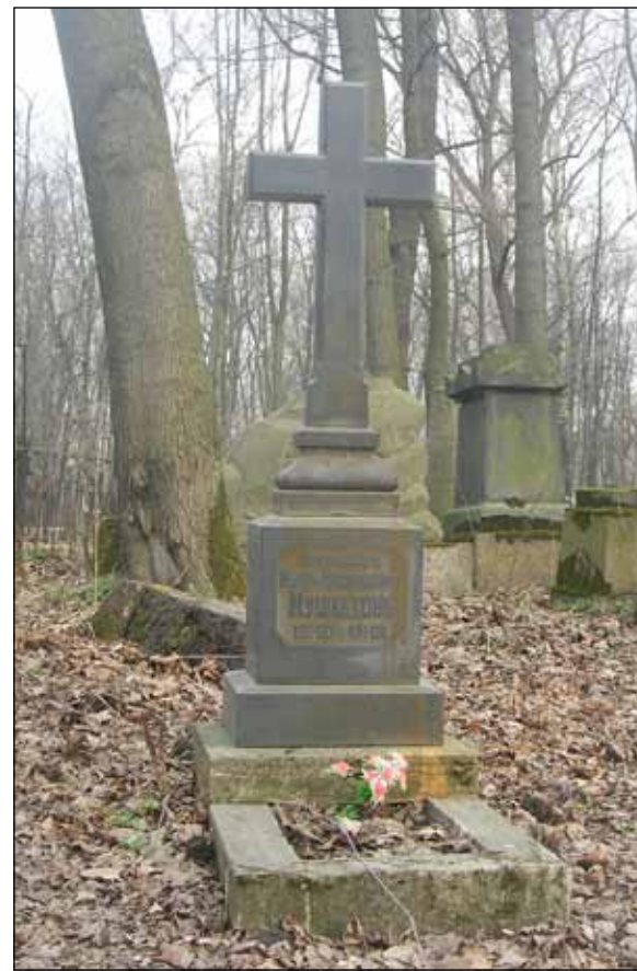
Захоронение Ивана Васильевича Мушкетова на Смоленском православном кладбище

Мушкетов был профессором Горного института в Петербурге,