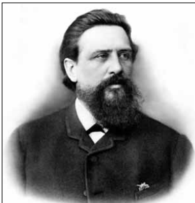
Иван Васильевич Мушкетов

115 лет тому назад, в 1902 году, в Петербурге скончался Иван Васильевич Мушкетов, выдающийся русский геолог, путешественник, исследователь Средней Азии, Урала и Кавказа, профессор Горного института. Был похоронен на Смоленском православном кладбище.