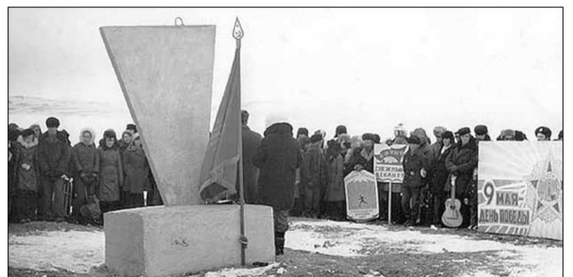
Митинг у памятника на острове Бруснева. 1970-е годы