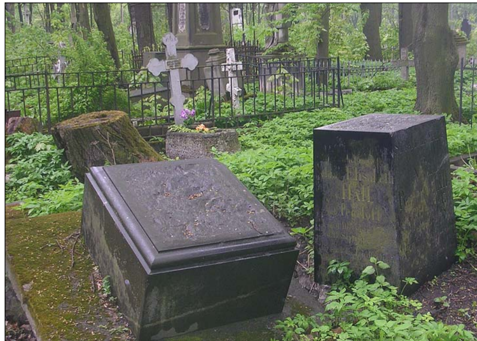
Захоронение А.В. Моллера (на фото слева) и Р.Р. Галла на Волковском лютеранском кладбище