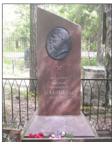
Захоронение Д.В. Наливкина