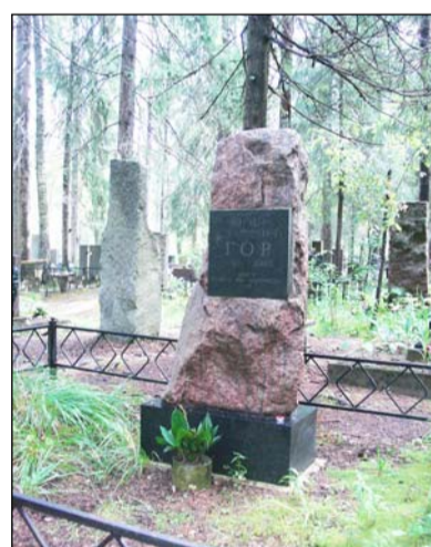
Захоронение Ю.Г. Гора