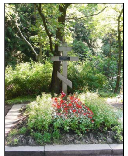
Захоронение И.Е. Репина