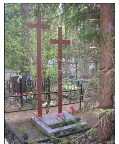
Захоронение Е.Н. Фрейберга