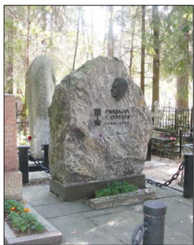
Захоронение М.М. Сомова