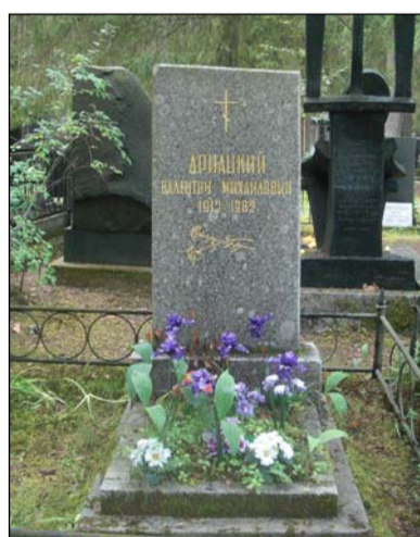
Захоронение В.М. Дриацкого