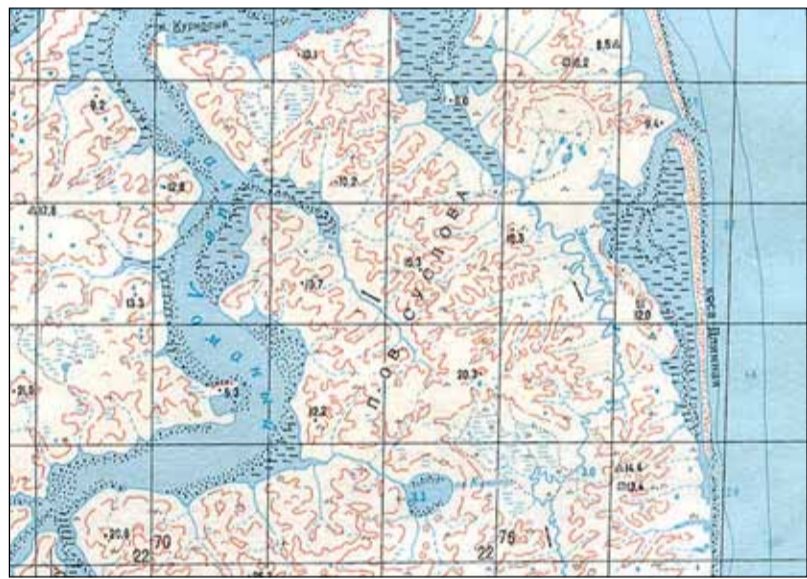
Полуостров Суслова на восточном побережье Таймыра