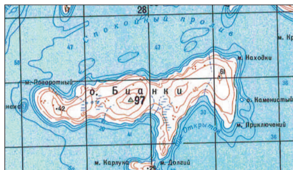
Остров Бианки в архипелаге Норденшельда в Карском море

Во время проведения наблюдений в среднем течении реки Камчатки Бианки побывал у подножия Ключевского вулкана и зареги-