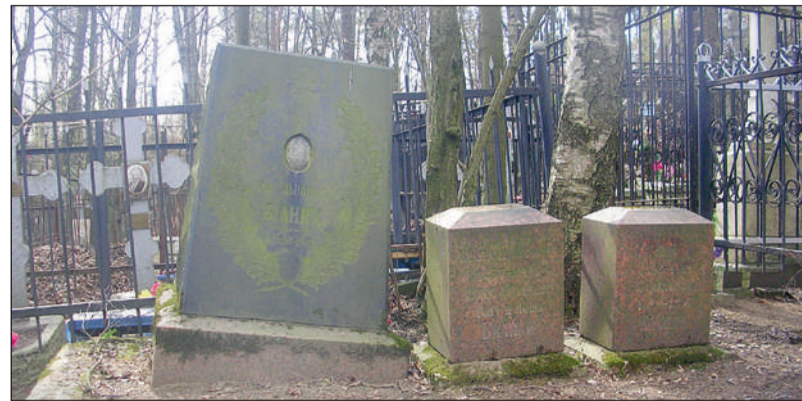
Захоронение В.Л. Бианки на Шуваловском кладбище

стрировал в районе Ключей 62 вида птиц. Далее он прошел вверх по реке до Козыревска, но в связи с наступлением осени и окончанием отпущенного ему срока экспедиционных работ был вынужден спуститься по реке в Усть-Камчатск, откуда через Петропавловск вернулся в Петербург.