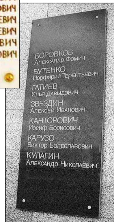
Мемориальные доски на наб. р. Мойки, 120, (вверху слева) и на ул. Беринга, 38