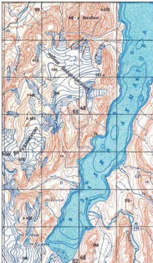
Гора Звездина на Северо-Западе острова Большевик в архипелаге Северная Земля

В Санкт-Петербурге фамилия Звездина увековечена на памятной стеле возле Арктического и Антарктиче-