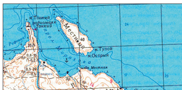
Пролив Морозова, отделяющий от материка остров Местный в Карском море

С 1910 года в чине полковника Корпуса флотских штурманов он возглавлял геодезическую часть Главного гидрографического управления. В 1911 году под его руководством были выбраны места для станций на мысе Марс-Сале и в проливе Карские Ворота.