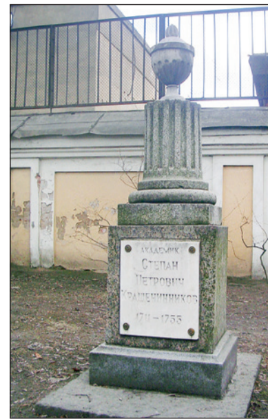
Захоронение С.П. Крашенинникова на Лазаревском кладбище Александро-Невской лавры

никова был случайно обнаружен и перезахоронен на Лазаревском кладбище Александро-Невской лавры. «Описание Земли Камчатки» вышло в свет уже после смерти автора. Этот замечательный труд был переведен на немецкий, английский, французский и голландский языки. Долгое время он был единственным источником знаний о Камчатке в европейской литературе.