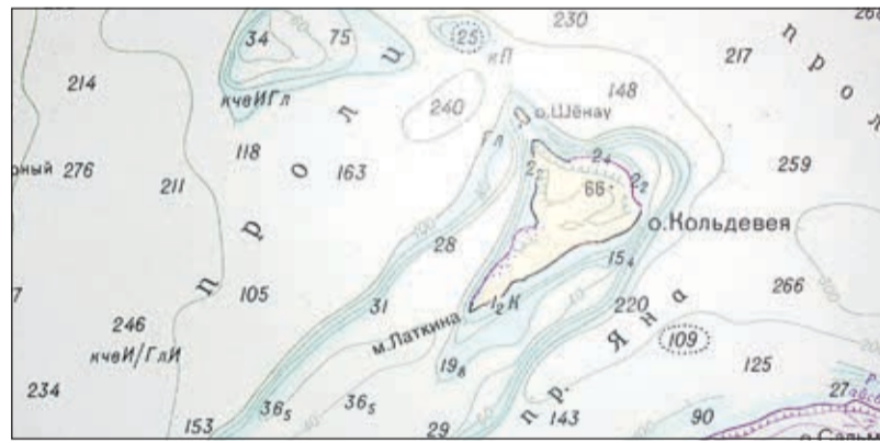
Мыс Латкина на острове Кольдевея в архипелаге Земля Франца-Иосифа

Именем Латкина назван мыс на острове Кольдевея в архипелаге Земля Франца-Иосифа.