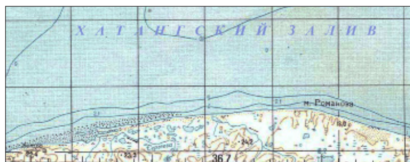
Река Сергеева, впадающая в Хатангский залив моря Лаптевых