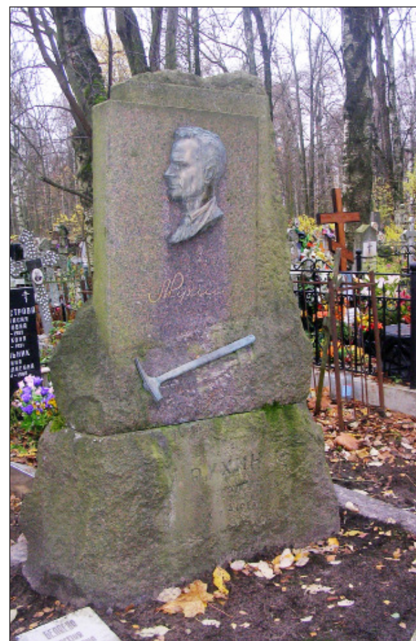
Захоронение Л.Б. Рухина на Серафимовском кладбище

та и 16-й линии Васильевского острова. Он был похоронен на Серафимовском кладбище.