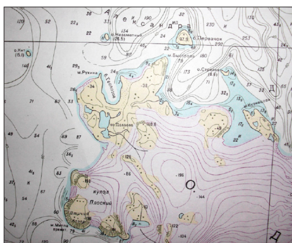
Мыс Рухина на северо-западе острова Джексона архипелага Земля Франца-Иосифа