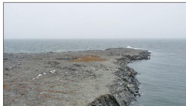
Мыс Случевского на острове Расторгуева (ныне острове Колчака) в Таймырском заливе Карского моря

Именем Случевского назван мыс на острове Расторгуева (ныне острове Колчака) в Таймырском заливе Карского моря.