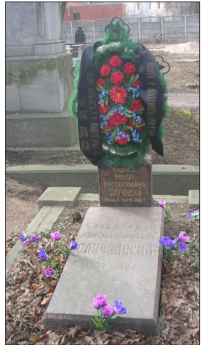
Захоронение К.К. Случевского на Новодевичьем кладбище

Случевский был не только переводчиком, поэтом, но и путешественником, членом Императорского русского географического общества