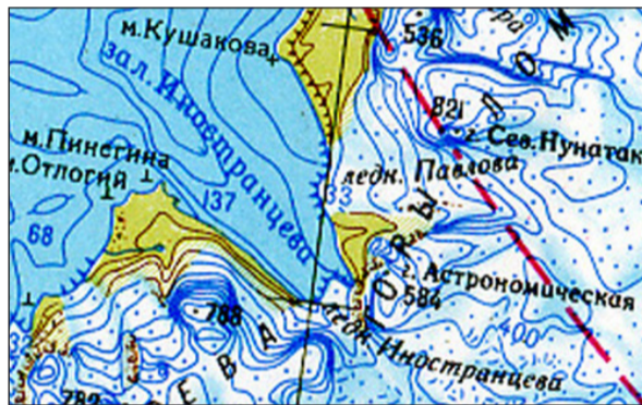
Залив и ледник Иностранцева на западном берегу северного острова Новой Земли

Собственные исследования Иностранцева посвящены изучению горных пород, минералов и геологического строения севера Европейской России. Круг его геологических интересов был широк: метаморфизм горных пород, стратиграфия, гидрогеология, палеонтология. В 1867 году он впервые в России применил метод микроскопического исследования пород.