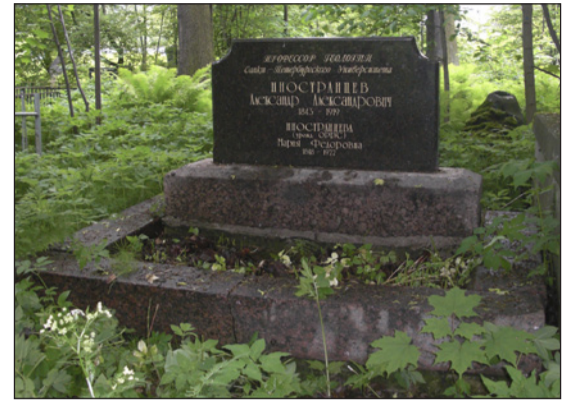
Захоронение А.А. Иностранцева на Смоленском лютеранском кладбище

В 1918 году отмечалось 50-летие службы Иностранцева в университете. Посвященная этому событию статья в газете «Наш век» завершалась словами: «И сейчас, к радости своих многочисленных учеников и друзей он пользуется завидным здоровьем и бодростью». Но 31 декабря 1919 года, не выдержав тяжелых условий жизни в Петрограде, вызванных блокадой и интервен-