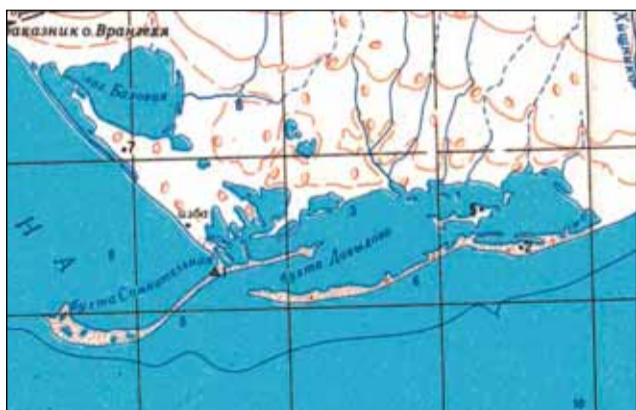
Бухта Давыдова на южном побережье о. Врангеля

Дежнева до реки Колымы, обработка материалов для лоции этого района, на основе которых в 1912 году были изданы «Материалы по лоции от Берингова пролива до реки Колыма».