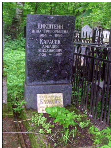
Захоронение А.М. Карасика