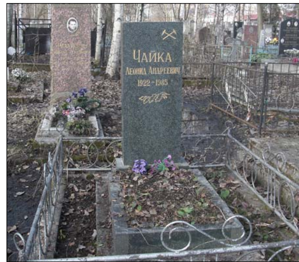
Захоронение Л.А. Чайки

ге. Современная его площадь составляет 27,4 га. Особо следует отметить, что информация о захоронениях на этом кладбище переведена в цифровую форму, эта работа ведется и для других некрополей.