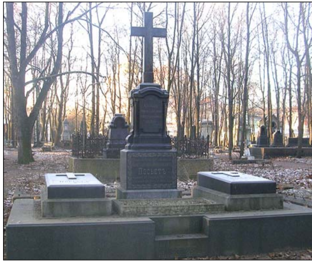
Захоронение К.Н. Посьета. Новодевичье кладбище

Последний удар по кладбищу был нанесен в конце 1960-х гг., когда Ленгорисполком постановил снести могилы, «которые не содержатся родственниками», а также убрать надмогильные сооружения, «не представляющие художественной и исторической ценности». Реализацию этого решения через некоторое время удалось приостановить благодаря