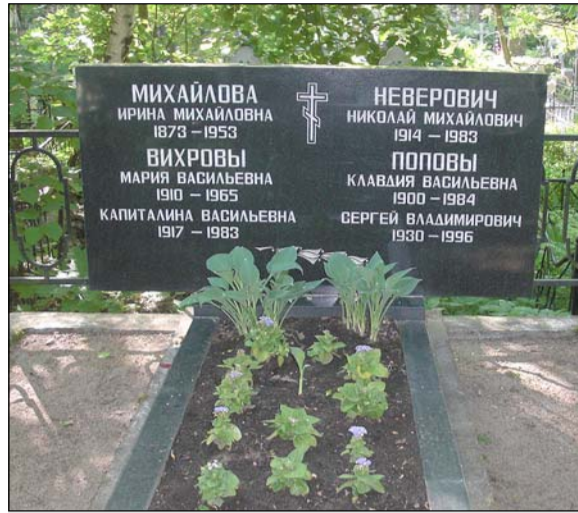
Захоронение С.В. Попова. Пороховское кладбище

вмешательству общественности, но тем не менее уничтожить успели около 400 надгробий, среди которых были памятники выдающимся деятелям культуры, науки, военным и государственным деятелям.