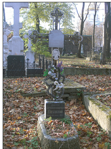
Захоронение Ю.С. Глебовского. Новодевичье кладбище