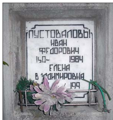
Захоронение И.Ф. Пустовалова