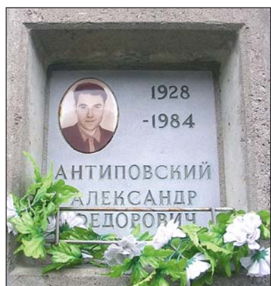
Захоронение А.Ф. Антиповского

на на карте Арктики» (СПб, 2009, изд. ВНИИОкеангеология) и «Арктический некрополь» (СПб, 2014, изд. «Посейдон»).