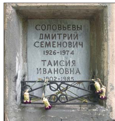
Захоронение Д.С. Соловьева