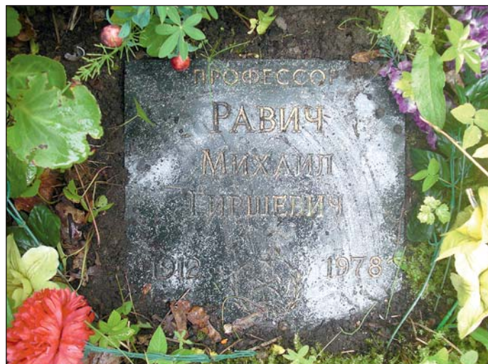
Захоронение М.Г. Равича