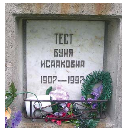
Захоронение Б.И. Тест