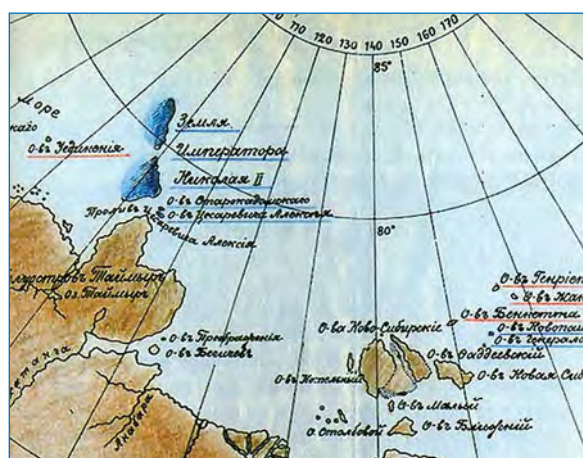
Очертания Северной Земли до 1930 года

медно-никелевом месторождении с лета 1923 года под руководством Урванцева начались круглогодичные геологические работы. Были построены дополнительные жилые и производственные помещения, заложены штольни и буровая скважина. Преодолевая все сложности жизни и работы в условиях Крайнего Севера, ликвидируя частые поломки и аварии, решая многочисленные технические проблемы, экспедиция добивалась достижения поставленной цели. Штольни вошли в сплошную сульфидную руду, а скважина, отстоящая от штольни на 100 м, также вошла в рудное тело и прошла по нему 12 м, что позволило сделать вывод о сохранении или даже увеличении мощности тела. К концу работ в августе 1924 года была добыта опытная партия в тысячу пудов руды, которую доставили в Ленинград для исследования в лабораториях Горного института и МЕХАНОБРА.