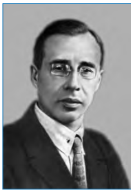
Н.Н. Урванцев. 1920-е годы

Организовав продолжение горных работ, Урванцев занялся обследованием озерно-речной системы к северу от Норильска. В ноябре 1921 года были обследованы река Норилка и озеро Пясина до истока реки Пясины. Путем промера и по желобу в ледяном покрове был найден фарватер. В Норилке глубины везде превышали 2 м, на озере не опускались ниже 1,5–2 м. В июне на рыбацкой лодке Урванцев отправился на обследование самого северного участка водной системы — реки Пясины. В экспедиции изъявил желание участвовать знаменитый промышленник Никифор Бегичев, намеревавшийся выбрать в районе устья Пясины место для зимовки организуемой им промысловой артели. Весь поход до устья Пясины, в процессе которого велись промер глубин, топографическая съемка берегов, создание астрономических пунктов, геологические наблюдения, продолжался полтора месяца. В результате тщательного обследования была установлена судоходность Пясины на всем ее протяжении, что существенно повысило промышленные перспективы норильских месторож-