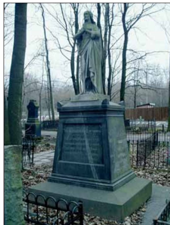
Захоронение Ф.П. Литке на Волковском лютеранском кладбище