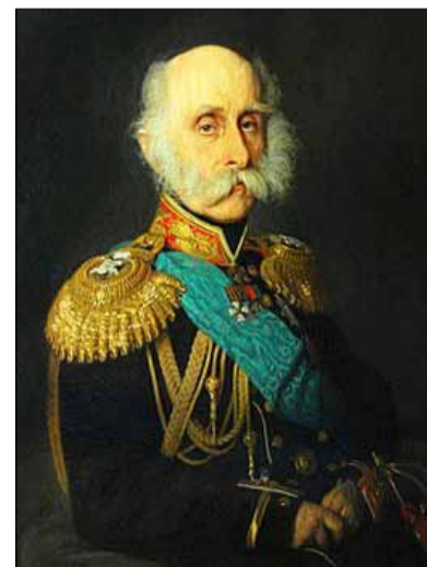
Ф.П. Литке, портрет работы И.Н. Крамского, 1871 г.

Помимо ордена Св. Анны IV степени, заслуги Литке отмечены орденами Св. Александра Невского, Св. Андрея Первозванного, Белого Орла, Св. Вла-